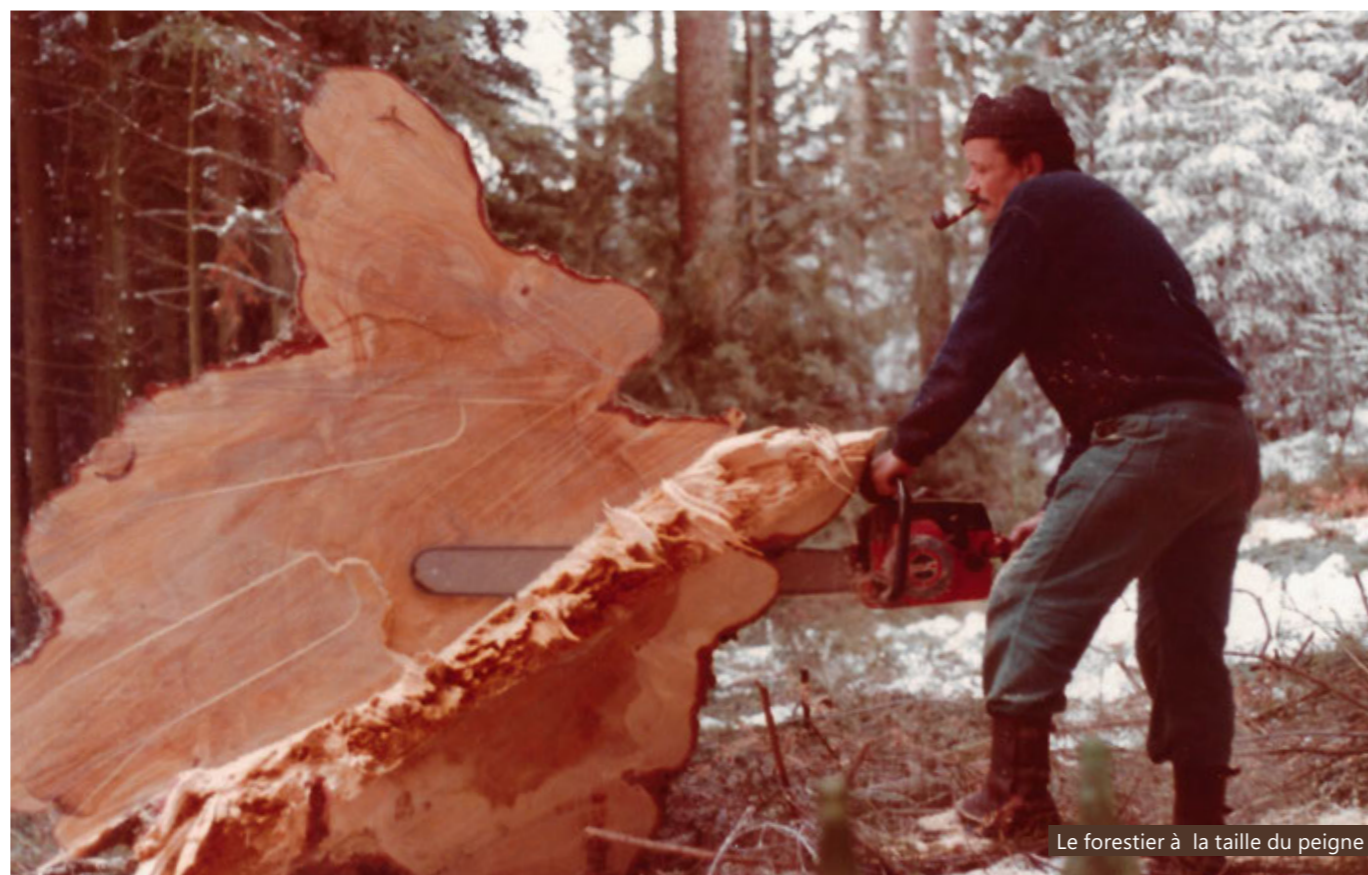
Le forestier à la taille du peigne

Fraichement diplômé, ses premières expériences se passeront dans sa Gruyère natale. Il rejoint pour un temps les forêts du 4 e arrondissement (de l'époque) en remplacement de François Pasquier, parti sous le soleil d'Afrique. Durant une année et demie, il s'occupe des forêts domaniales de Bouleyres, Chésalles, du Dévin de Maules et de Sautau ainsi que du triage de l'Intyamou. Une restructuration des triages lui permet ensuite de conserver les forêts domaniales du 4 e arrondissement, tout en devenant adjoint du 3 e . La transition vers un poste fixe se passe bien même s'il reconnaît quelques appréhensions lors des premiers martelages en forêts privées: «Il y a le souci de bien faire, de faire juste» comme il le dit. Et de rajouter: «Parfois il faut aussi savoir arrondir les angles. Ne pas arriver avec ses gros souliers et considérer les besoins de chacun».