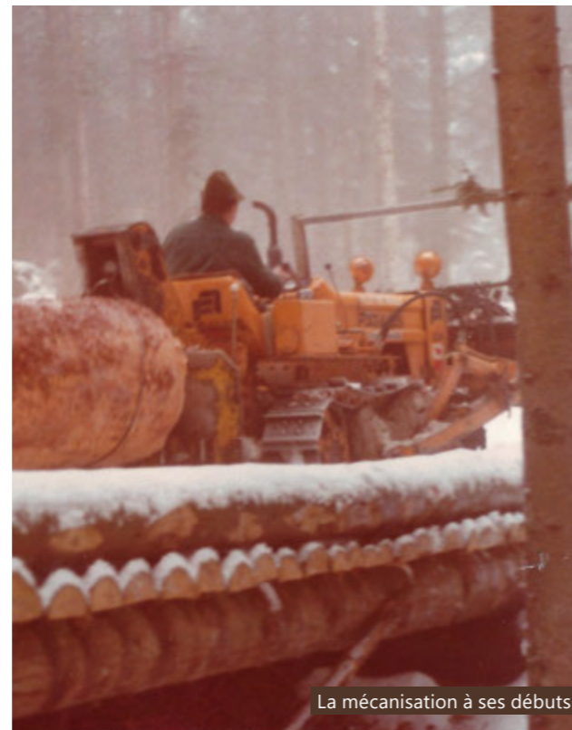
La mécanisation à ses débuts

De manière générale, la mécanisation du secteur forestier en est encore à ses prémices. Ces balbutiements mécaniques, bien que restreints, voient apparaître les premiers tracteurs forestiers. La Ville de Bulle dispose pour sa part d'un petit tracteur conçu en premier lieu pour la