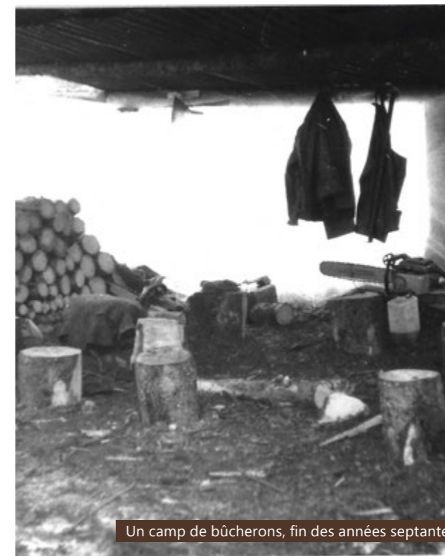
Un camp de bûcherons, fin des années septante