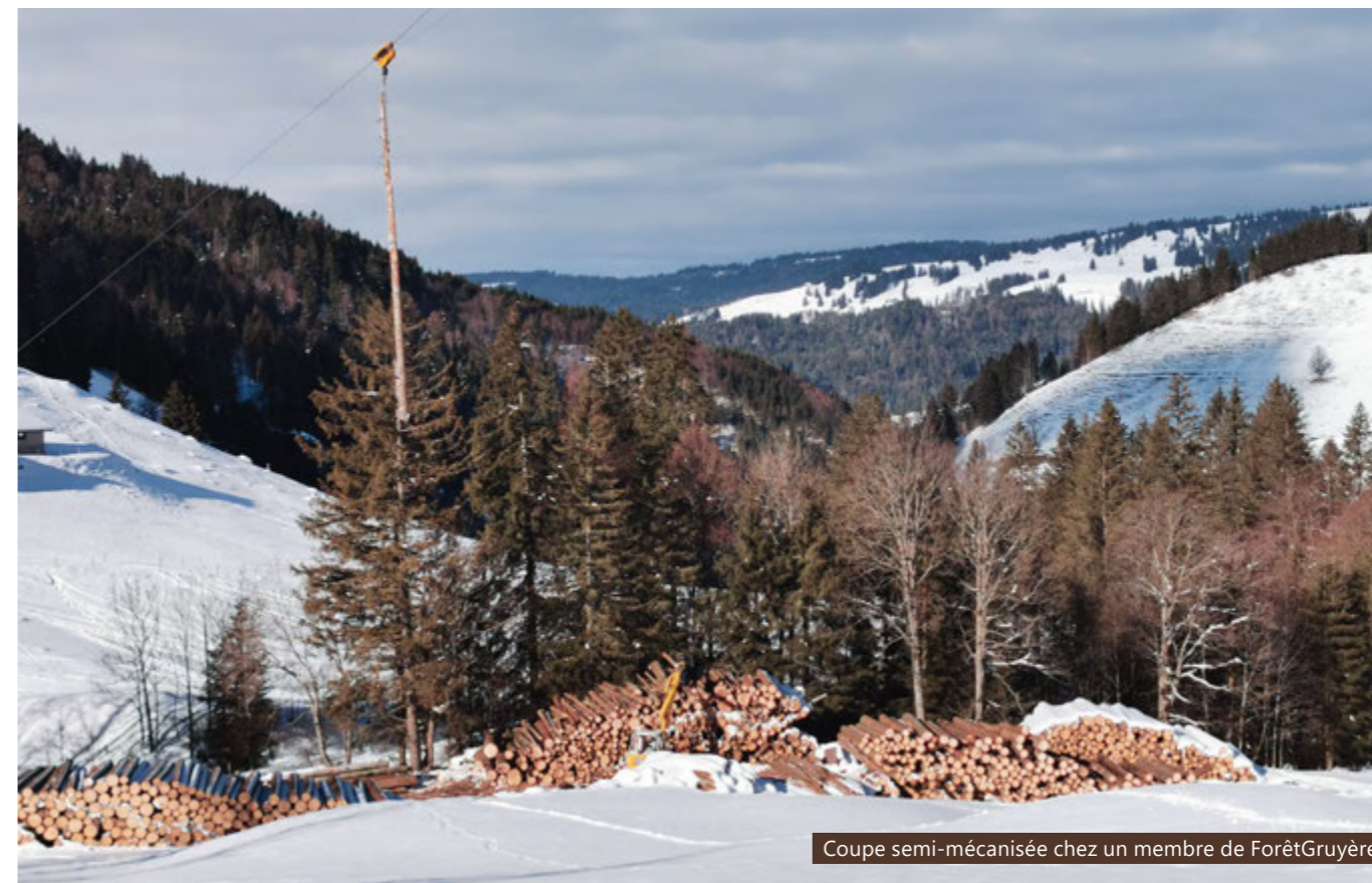
Coupe semi-mécanisée chez un membre de ForêtGruyère

L'association des propriétaires forestiers participe aussi à un projet pilote en pâturages boisés. Ces milieux particuliers sont d'une importance prépondérante car ils améliorent l'aspect paysager ou servent de refuge à certaines espèces animales et végétales. En Gruyère, quatre projets situés sur les communes de Haut-Intyamon et de Val-de-Charmey doivent permettre d'identifier et relever les défis propres à ces milieux. ForêtGruyère y prend part notamment au travers de travaux visant à conserver la structure caractéristique des pâturages boisés. Cela passe entre autres par des coupes de bois pour éviter la fermeture progressive des pâturages et le retour de la forêt. Maintenir une régénération dans les secteurs boisés et favoriser les essences adaptées au climat font également partie des mesures envisagées. Un alpage de la Commune de Val-de-Charmey devrait profiter de certains de ces travaux dès l'automne 2025.