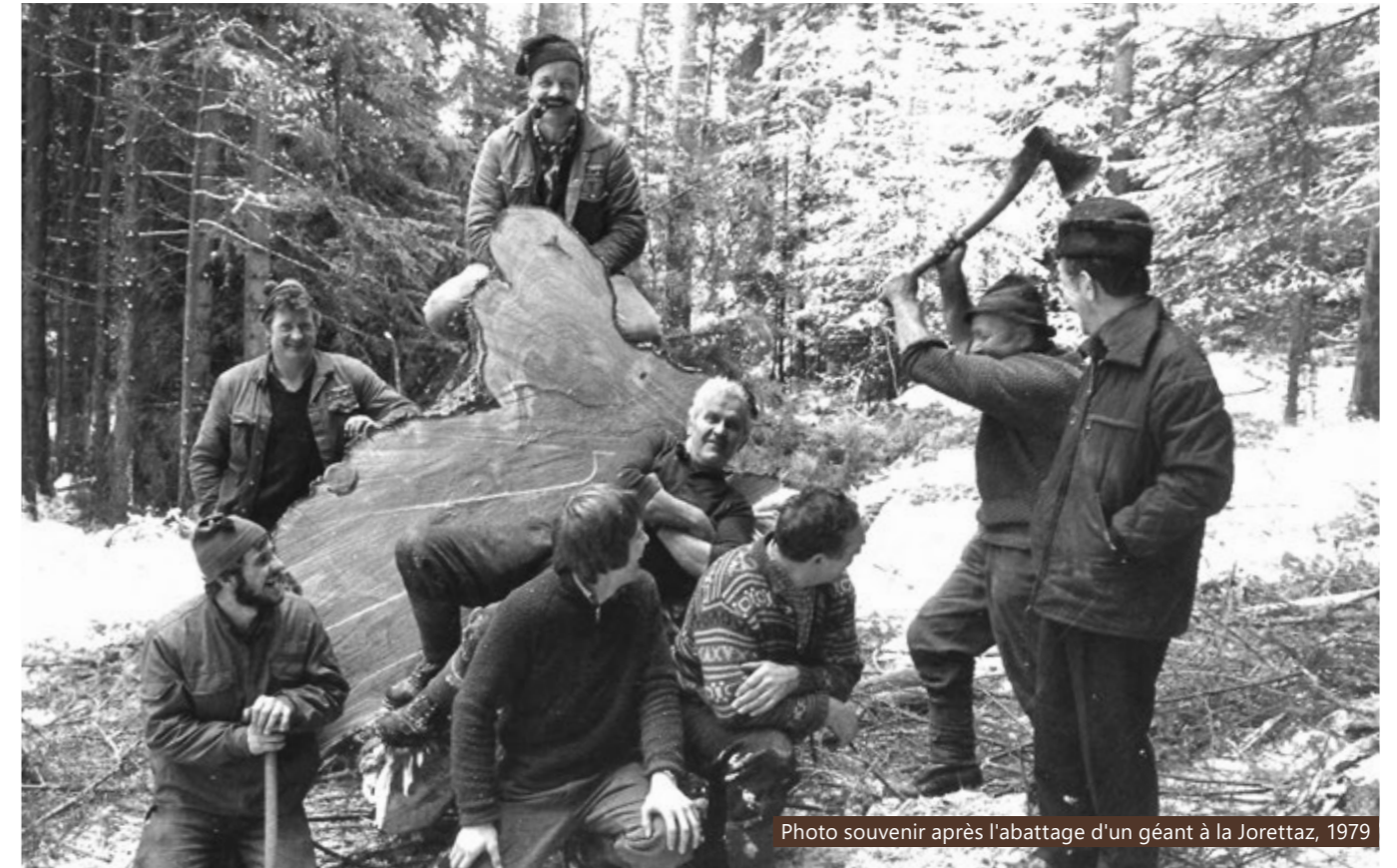
Photo souvenir après l'abattage d'un géant à la Joretaz, 1979

vigne. L'engin d'un mètre septante de large est équipé d'un treuil qui sert au débardage des bois situés à proximité de la desserte. Car lorsque qu'on ne peut pas accéder aux tiges abattues, il faut chabler ou débarder à l'aide de luges. Des travaux qui semblent aujourd'hui herculéens quand on sait que de surcroît, les bois (résineux) sont systématiquement écorcés sur le parterre de coupe. A la main bien sûr, une évidence.