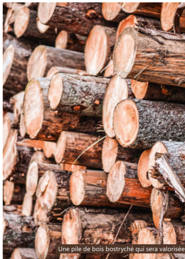
Une pile de bois bostryché qui sera valorisée

Parmi les activités de ForêtGruyère, la gestion du bois énergie est une tâche importante dans l'agenda annuel de l'association. En jouant le rôle d'intermédiaire entre propriétaires forestiers et énergéticiens, ForêtGruyère facilite l'utilisation du bois-énergie dans la région. Les contrats établis permettent aux propriétaires de commercialiser des volumes conséquent à des tarifs équitables. De leur côté, les entreprises d'énergie s'assurent un approvisionnement de qualité ainsi que la livraison des volumes nécessaires au bon fonctionnement de leurs installations de chauffage. Chaque année, plusieurs milliers de m 3 de copeaux provenant des unités de gestion et des entreprises forestières privées sont destinés aux différentes centrales gruériennes.