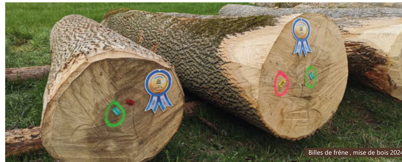
Billes de frêne, mise de bois 2024

De cette 7 ème édition, ForêtGruyère se félicite de l'engouement toujours présent et du vif intérêt manifesté par les différents acteurs. En témoignent les volumes toujours constants mis à disposition, leur qualité, des prix de vente à la hausse ainsi que la valorisation de l'ensemble des produits proposées. Car cette année, toutes les billes exposées ont su trouver preneur, soulignant ainsi le succès de la manifestation du 8 mars 2024.