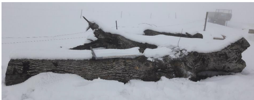
Exemple 2 : Noyer : L = 2m / diam = 50cm