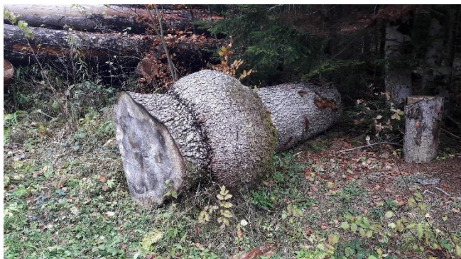
Beispiel 3: Tannenverwachsung.

Bei Fragen zögern Sie nicht uns zu kontaktieren.