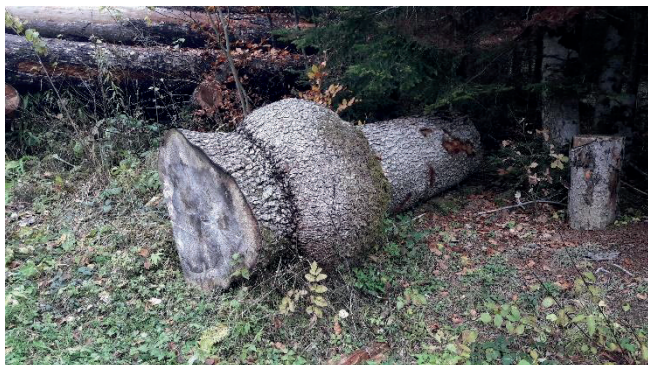
Exemple 3 : Loupe de sapin blanc

N'hésitez surtout pas à nous contacter pour poser vos questions concernant l'opportunité de vendre une bille ou si vous ne savez pas comment transporter vos bois. Nous trouverons une solution.