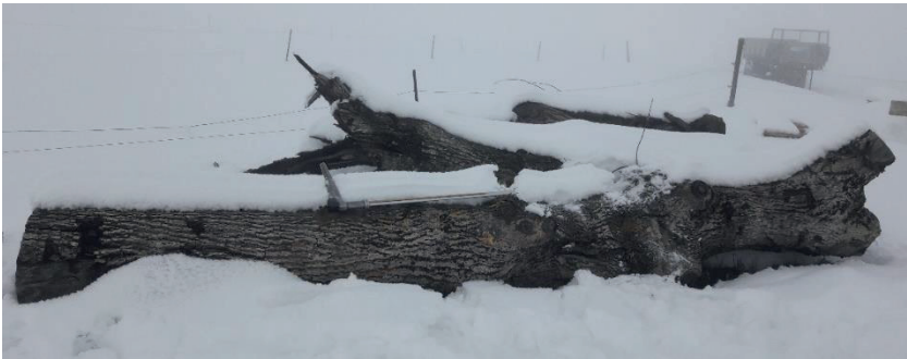
Beispiel 2: Nussbaum: L = 2m / Durchmesser = 50cm