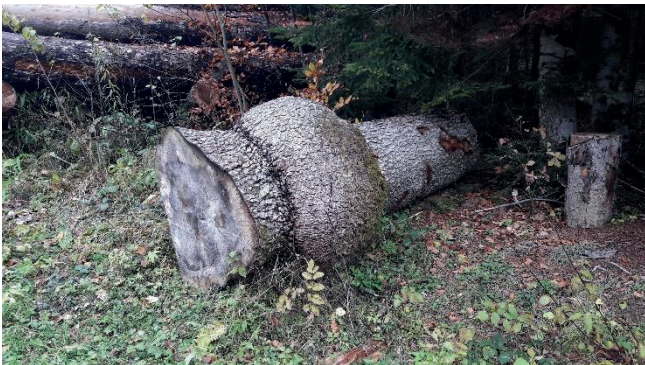
Beispiel 3: Tannenverwachsung.

Bei Fragen zögern Sie nicht uns zu kontaktieren.