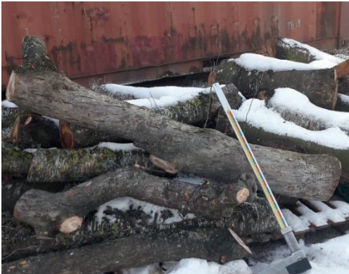
Beispiel 1: Apfelbaum: L = 1.60m / Durchmesser = 25 cm

Zögern Sie nicht diese Stämme mitzubringen, auch wenn sie teilweise Fäulnis aufweisen. Im Zweifelsfall stehen wir Ihnen gerne zur Verfügung.