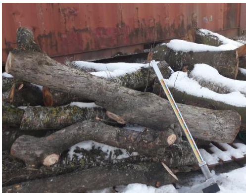
Beispiel 1. Apfelbaum: L = 1.60m / Durchmesser = 25 cm