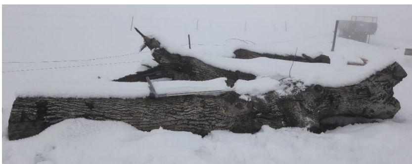
Exemple 2. Noyer : L=2m / diam =50cm